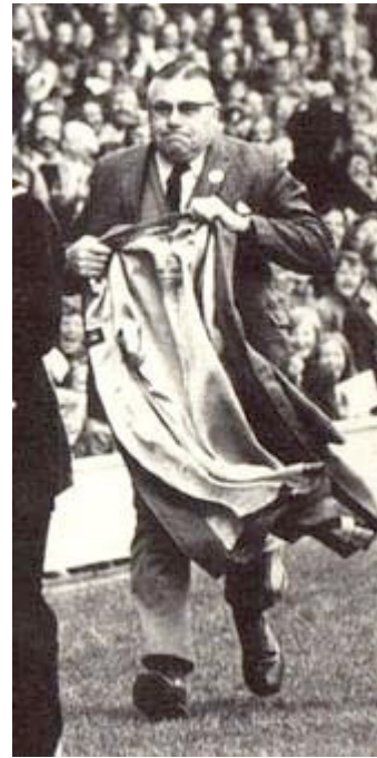
7. e 8. “Twickenham Streaker” (detalhe)

Este fenômeno de repercussões entre a gestualidade e as disposições próprias às personagens da ação não é casual na representação visual (tampouco é o resultado de algum aspecto intrínseco à arte fotográfica ou ainda ao regime de suas relações com o texto escrito, como nos querem fazer supor certas semiologias) 16 , mas se restitui à ordem de um operador visual próprio à arte pictórica. Por exemplo, em seu Trattato della Pittura , Leonardo recomendava ao artista apreender visualmente as figuras com aquela atitude exclusivamente própria à operação na qual serão efetivamente representadas: de modo tal que, ao vê-las, conheçamos imediatamente o que pensam e o que intentam dizer; os meios para a realização deste princípio se dispõem àquele que melhor observar (por exemplo, na linguagem própria aos surdos-mudos)