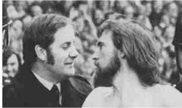
3. e 4. “Twickenham Streaker” (detalhe)

Nossa familiaridade com este fenômeno de repercussões decorre certamente do fato de que nos comportamos usualmente assim, mas o aspecto mais forte da questão diz respeito ao modo como esta experiência é traduzida pictoricamente (e repercutida, em nossos modos de ver a fotografia): estamos habituados a reconhecer em uma certa espécie de tratamento visual dos gestos os correspondentes semióticos de uma conversação, e a história da arte está certamente repleta de exemplos que ilustram precisamente esta complementariedade que a representação da atitude humana acarreta, em contextos expressivos, especialmente para uma forma de arte à qual faltam precisamente os correlatos verbais.