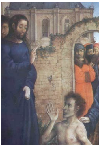
5. Juan de Flandes – “A Ressurreição de Lázaro”c. 1512/1518 (detalhe) – Museu do Prado

disposições e de encarnação física das ações, a partir da Renascença (fig. 6). Isto posto, entretanto, não nos resta dúvidas de que reconhecer nos gestos das personagens desta foto seu devido valor retórico não decorre da pregnância com a qual o registro fotográfico as firmou numa superfície sensível, mas dos hábitos perceptivos com os quais reconhecemos o valor de redundância das atitudes corporais das personagens 15 .