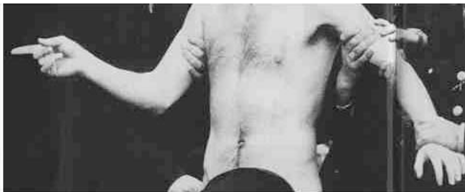
2. “Twickenham Streaker” (detalhe)

Em primeiro lugar, o movimento e o gesto humanos representados na foto (fig.2): notamos nesta imagem algo a que os historiadores da arte designam como parte de um sistema da gestualística, próprio às representações pictóricas: esta linguagem dos gestos atendeu a fins muito diversificados na história dos estilos, mas, na análise desta fotografia, interessa-nos verificar que a expressão gestual está, de algum modo, remetida precisamente aos marcos da legibilidade. Em primeiro lugar, devemos admitir que as atitudes das personagens desta cena não se abandonam a uma pura gratuidade de sua disposição (não estavam simplesmente dados ao dispositivo), mas se coordenam numa dimensão que não é apenas plástica e expressional, mas também dramática.