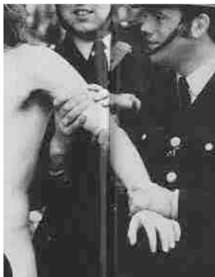
9. e 10. “Twickenham Streaker” (detalhe)

Nestes gestos, não encontramos qualquer correspondência ritualística para servir de base à leitura de suas funções no contexto da composição visual: seu sentido mais evidente diz respeito à expressão, iconicamente modelada,