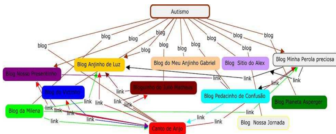
Figura 1 – Linkagem da rede temática sobre Autismo e Síndrome de Asperger em blogs (Blogroll)

De 17 blogs contatados, 13 autores entraram em contato, através do e-mail, concordando em participar da amostra selecionada, perfazendo, portanto, 74,5% dos blogs encontrados sobre o assunto. Bem menor, no entanto, foi o número de autores que concordaram em responder ao questionário elaborado (seis). A observação dos blogs foi feita privilegiando-se a relação existente entre os blogs através de links no blogroll e da presença de comentários. A figura abaixo (Fig.1) representa esta rede temática: